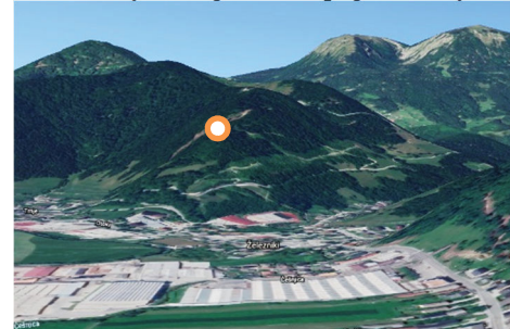
Lokacija novega križa – pogled s Studenega

Snegovnik je hrib nad opuščeni kamnolomom ob glavni cesti, ki pelje skozi Železnike. Hrib je bil leta 1935 videti precej drugačen, kot je danes. Ni bil poraščen, pač pa so bili na njegovem pobočju travniki in njive. To je videti tudi na starih razglednicah. Danes pa je hrib poraščen z gozdom, zato je bilo treba del gozda posekati, da se bo križ videlo na vse strani. Tako smo se dogovorili tudi z lastniki parcel in Zavodom za gozdove Slovenije.