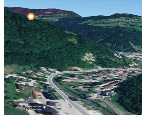
Lokacija novega križa – pogled s Trnja