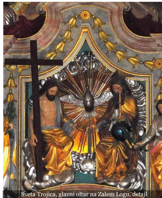
Sveta Trojica, glavni oltar na Zalem Logu, detajl

S slavo Trojice so vsa razsvetljena večna nebesa in vse ji prepeva, naj bi še v nas se zbudila ljubezen in jo slavila.