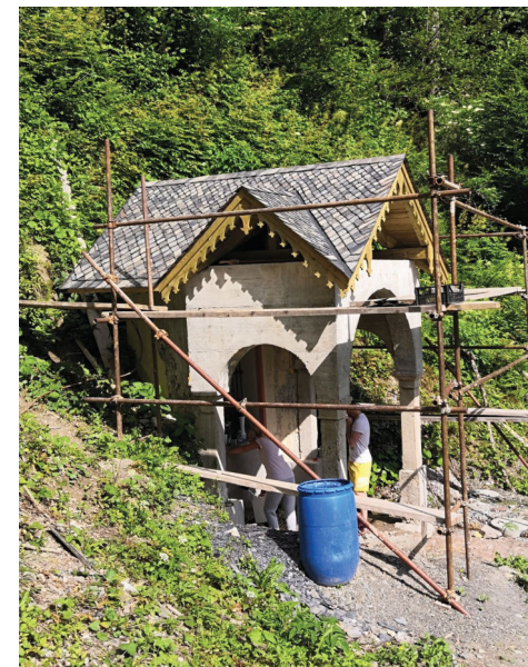
Streha, ki je bila po zadnjih obnovah dvokapna, je sedaj ponovno križna z dvema pravokotnima slemenoma na različnih višinah. Pokrita je s škrljcem.