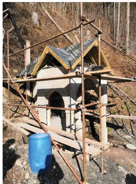
Pozno jeseni 2019 je bila kapelica že na novo zgrajena. Streha je bila zaščiten s samolepilnimi hidroizolacijskimi bitumenski trakovi.