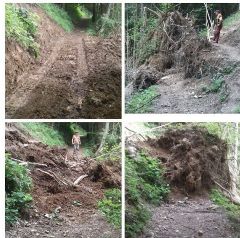
Čiščenje terena in popraviljanje dostopne poti »Na angela« se je izvedlo v letu 2018.

Viharni veter je podrl tudi drevesa na dostopni poti do cerkve v Suši, od koder se je po cevi spuščal gradbeni material za oskrbovanje gradbišča pri kapelici.