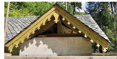
Obnovljeno kapelico bodo krasili skrbno načrtovani in izdelani detajli, kot na primer lesene strešne čelne letve.

Kapelica čaka še na zaključna dela: izdelavo ometov, beljenje, izdelavo stropne freske, namestitev nove cevi za vodo in talne odtočne rešetke, polaganje tlakov, ureditev okolice in dostopne poti.