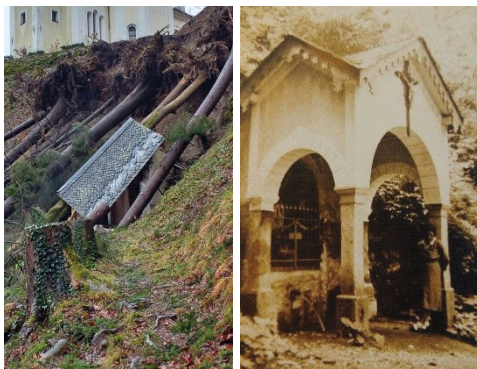
Porušena kapelica in fotografija iz leta 1939.

Sklenili smo, da bomo rekonstrukcijo kapelice izvedli po videzu, kot ga je imela kapelice pred drugo svetovno vojno.