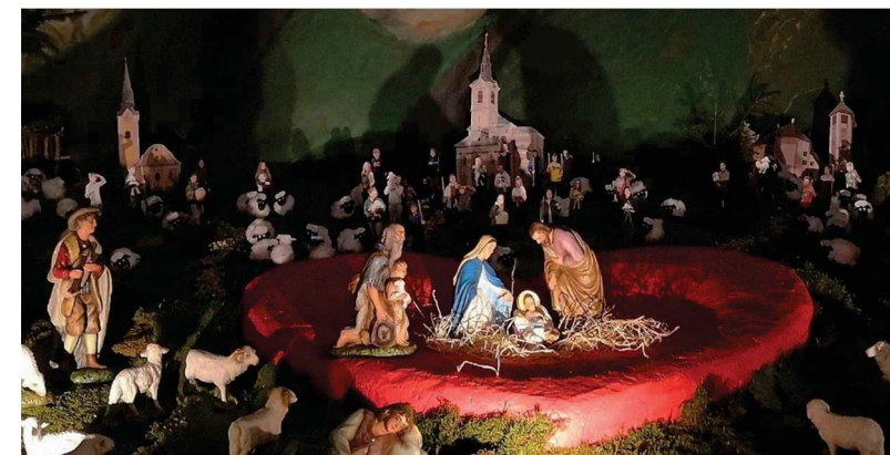
Birmanske jaslice, Železniki 2021

Bog je ob začetku našega časa stopil v naš svet kot otrok, ne ker bi ga bil človek vreden, ampak