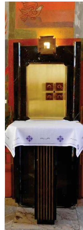
Tabernakelj in večna luč v cerkvi sv. Lucije v Dražgošah (Stane Kregar)

vso lepoto mu razkrivaj, naj Ti vredno pesem poje.