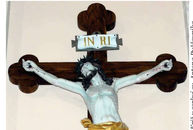
Križ v cerkvi sv. Antona Puščavnika

V poljub oltarja polaga duhovnik svoje in naše življenje, kakor bi hotel povedati, pokazati in sporočiti: »Gospod, glej na nas, tukaj smo, tebi se darujemo, tebi živimo!«