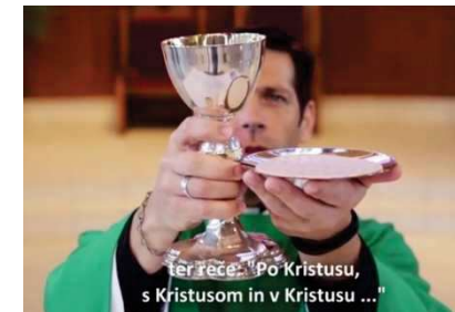
Po Kristusu, s Kristusom in v Kristusu ... Amen, www.luc.si

Ti vzkliki so na neki način naša kratka veroizpoved in s tem poudarimo dva temelja tega, kar verujemo: »Jesusovo smrt in njegovo vstajenje«; zato veljajo ti vzkliki kot naš odgovor na Božjo ljubezen, ki se je sklonila na oltar.